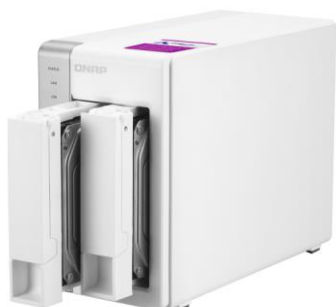
Servidor c/ 2 discos