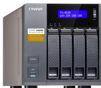
Servidor c/ 4 discos