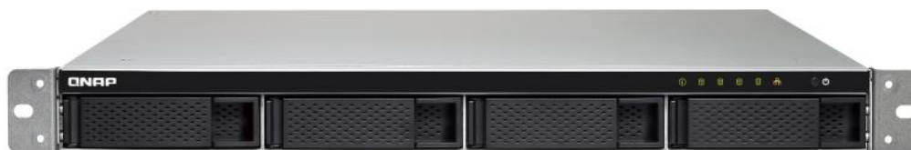
Servidor em Rack c/ 4 discos

Como cada organização é um caso é específico, recomendamos que caso estejam interessados devem contactar-nos através de email.